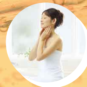
ミスト浴でお肌もスベスベ

そんなお客様の疑問にお答えするために ご利用なさっているご家庭をレポートします!