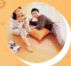
ムラなく床全体を暖める