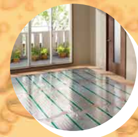
床下でお湯が循環