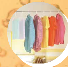
梅雨時の洗濯もラクラク