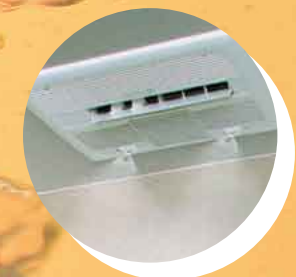
やさしいミストの快適さ